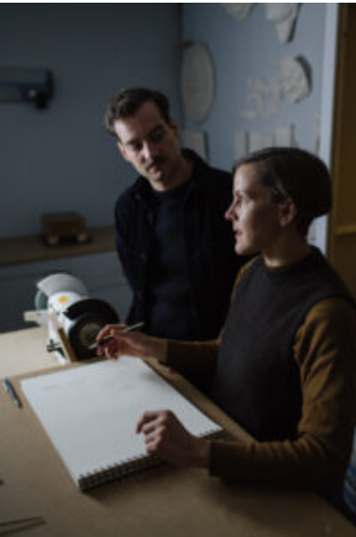
® Elodie Timmermans