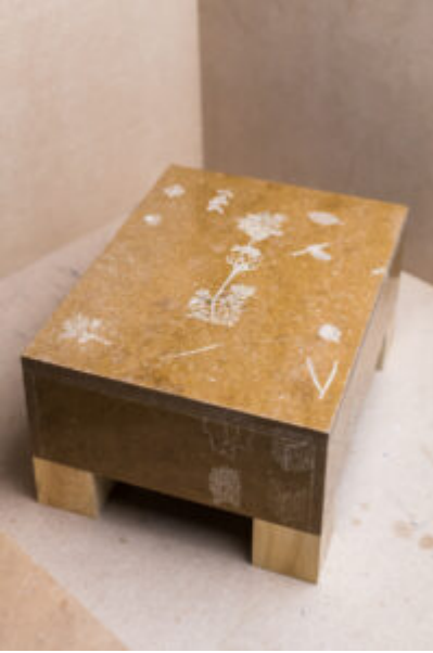
® Elodie Timmermans