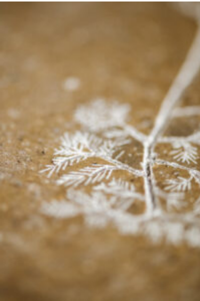
® Elodie Timmermans