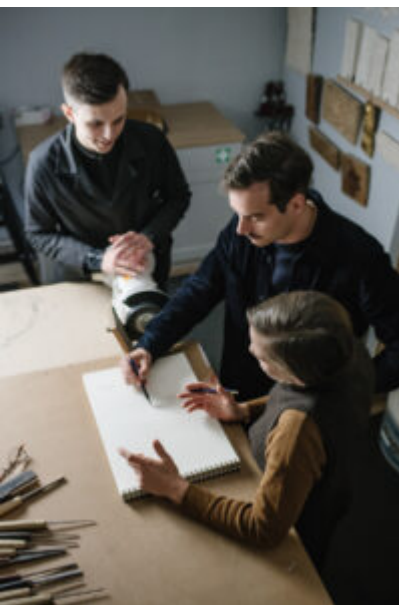
® Elodie Timmermans