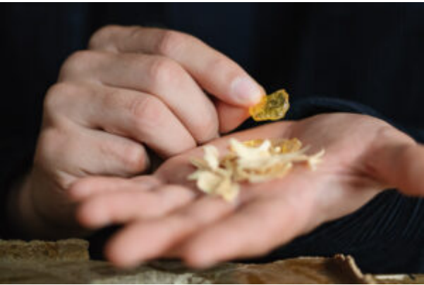
® Elodie Timmermans