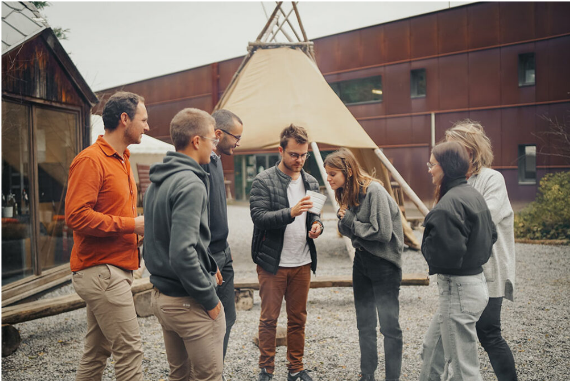
Bootcamp Wonderful.Stream