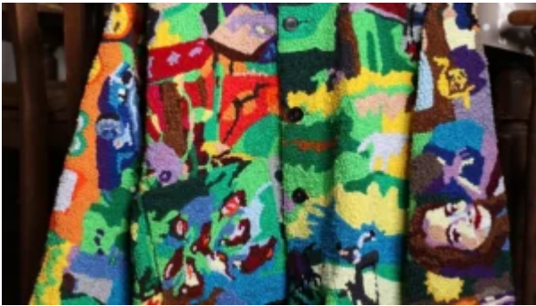
Community Couture © Aniela Fidler Wieruszewka

Le rapport aux objets est questionné notamment au niveau de la valeur qui leur est consacrée . Celle-ci se base sur différents types d'interactions avec l'objet, pouvant être de l'ordre de l'émotionnel, historique, etc. qui induisent des comportements distincts : en prendre soin, le réparer. La valeur financière de l'objet, quant à elle, varie aussi avec les moyens de productions et les valeurs qui y sont insufflées : qualité des matériaux, traitement, conditions de travail, provenance, etc. Le dialogue avec ces notions de valeur était exploré dans Value // Values du Studio Nienke Hoogvliet ( en savoir plus ).