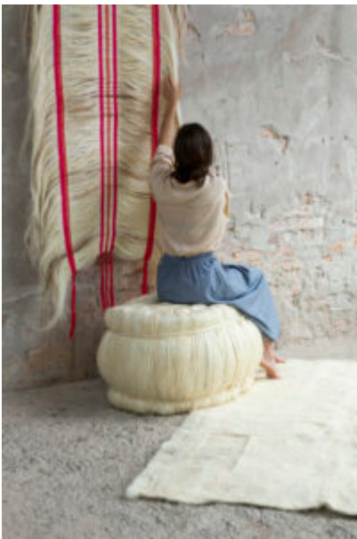
Unravelling the Coffee Bag – Rosana Escobar

Avec son projet Unravelling the Coffee Bag , Rosana Escobar déconstruit les sacs de grains de café pour revenir au matériau de base, le fique, plante colombienne, qu'elle tente de détacher du marché duquel il dépend ( en savoir plus ). Ginevra Petrozzi propose quant à elle de questionner les données traitées par les réseaux sociaux, données trop aisément par leurs utilisateur·trice·s : dans Digital Esoterism , elle propose d'entrer en interaction avec le visiteur, et plus particulièrement avec les contenus sponsorisés d'un réseau social, pour en faire une lecture divinatoire. Une approche originale qui permet néanmoins une réflexion sur notre comportement numérique ( en savoir plus ).