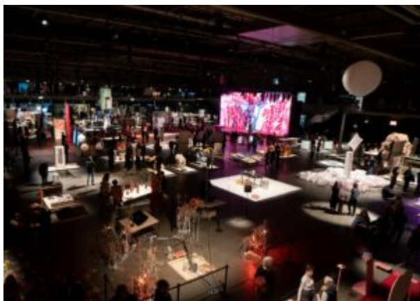
Graduation Show