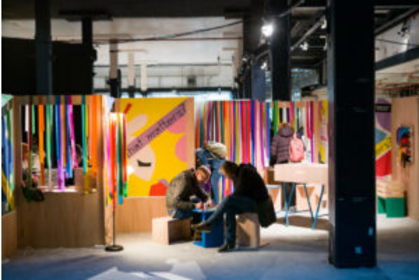
Community Couture

collectives, d'objectifs partagés et d'espoirs pour l'avenir ( en savoir plus ).